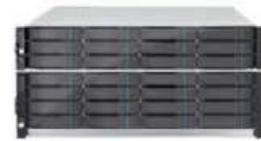
Menos esfuerzo de mantenimiento con almacenamiento confiable

Surveon hace la diferencia en video vigilancia de aeropuertos. Las cámaras de ojo de pez de Surveon proporcionan vistas de 360° en los aeropuertos sin ningún punto ciego, eliminando así el costo de instalar cámaras adicionales.