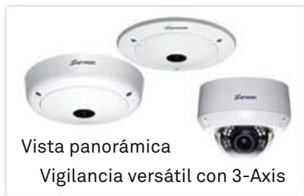
Vista panorámica Vigilancia versátil con 3-Axis