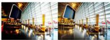
Calidad de imagen superior bajo luces complejas